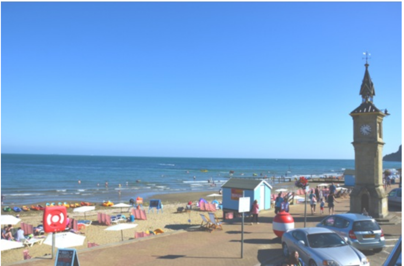
Isle of Wight beach